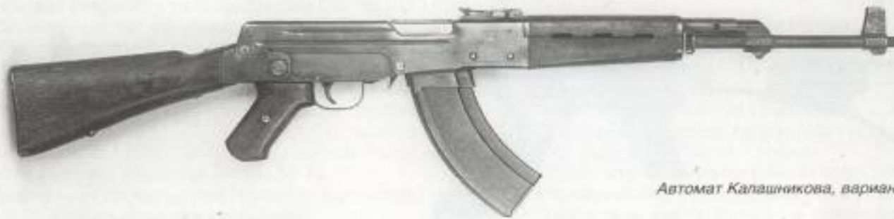
Автомат Калашникова, вариант 2

В 1947 году автомат Калашникова побеждает в конкурсе и принимается на вооружение.