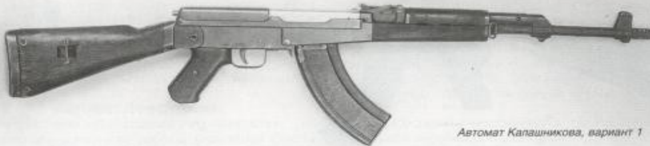
Автомат Калашникова, вариант 1